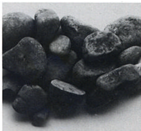
ここに紹介するのは、何のへんてつもないた

だの石ころです。ところが、よく観察すると(カラー写真でお見せできないのが残念ですが)表面に赤い粉と白っぽい土が付着していることがわかります。赤い粉は酸化鉄から作られたべんがら、白い土は粘土なのです。西都原13号墳から掘り出されたこの石ころから、死者を収めた木棺は粘土でおおわれ、さらにその上に小石をまんべんなく敷き詰め、べんがらをまいたことが読み取れます。西都原一帯を治めていた首長が葬られる時、彼の配下にあった人々は、酸化鉄を焼いてべんがらを作り、粘土や川原の石を運び、ていちょうに埋葬したに違いありません。これらの物を運びながら彼らはいったい何を思っていたのでしょうか。死んだ首長をしたう悲しみでしょうか。あるいは先行きの不安でしょうか。ただの石ころから想像は大きくふくらみます。(石川)