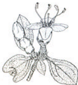
イチフサコメツツジ