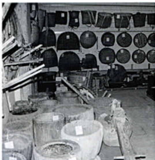
収蔵されている「日向の山村生産用具」

宮崎県は、県域の約4分の3が山地です。これらの資料は、その大部分をしめる九州山地で使用された各種の生産用具を集大成したもので山村特有の自給的な生産活動の様相を示すものや照葉樹林の豊かな樹生を利用した生産活動を示すもの、平地農村との交流を示すものなどが含まれ、この地の多彩な生産活動を裏づけるものとなっています。(地村)