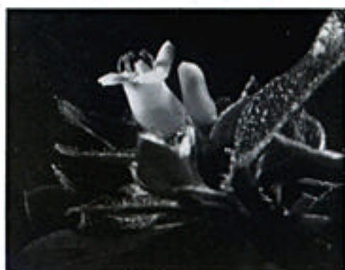
ツクシコメツツジ

ツクシコメツツジは宮崎県と大分県の県境に広がる岩場の多い山岳地帯に、イチフサコメツツジは熊本県境の山地に自生しています。花は白く、米粒ほどしかありません。いずれも、他のコメツツジ類がこれらの山地で隔離され、種分化したものと考えられます。自生地での保護が望まれます。（南谷）