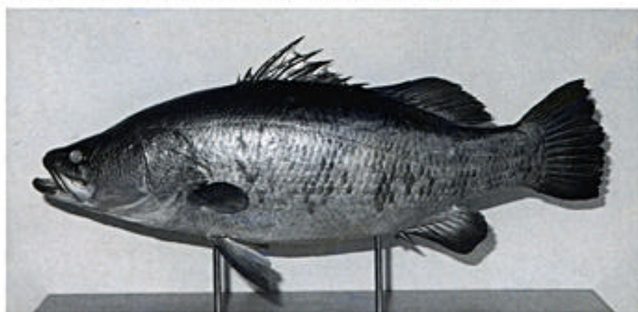
全長 95cm、 体重 13.5kg

1992(平成4)年6月19日午後、中学生の津屋浩憲さんが、延岡市の北川河口付近で釣り上げたのが、アカメ(写真)です。アカメは、目がルビーのように赤く輝くところから名付けられています。大きなものは、全長1.5m、体重40kgに達します。日本では、おもに宮崎県と高知県に分布する日本固有種で、レッドデータブック(日本の絶滅のおそれのある野生生物)では希少種となっています。幼魚は「ハゴ」、10kg以上になると「マルカ」と県内では呼ばれています。ゆうゆうと泳ぎ回り、小魚類をひと口に飲みこむところなど、どう猛な面を持っていますが、その生活状態や産卵場所など不明なところが多く幻の魚と言われる由縁となっています。(岩崎)