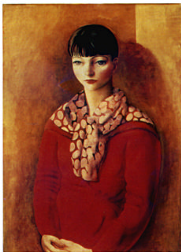
「赤い服を着たモンパルナスのキキ」モイーズ・キスリング