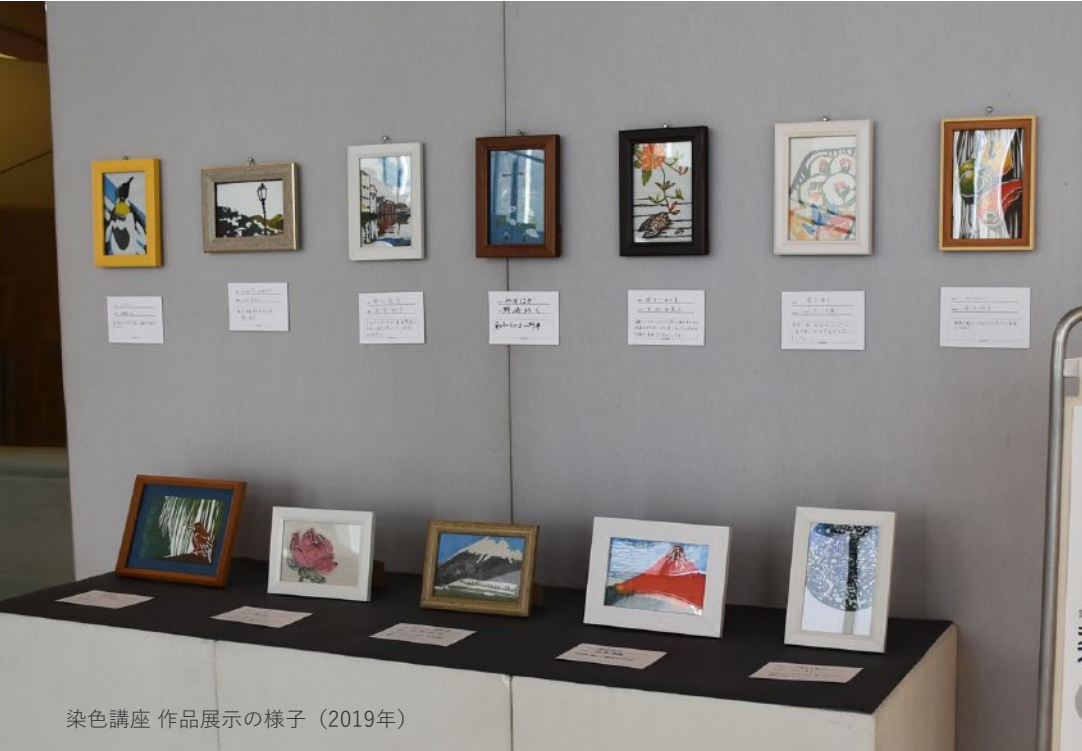
染色講座 作品展示の様子（2019年）