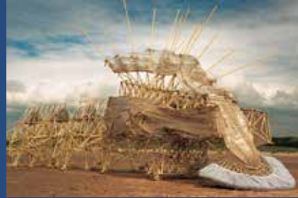
《アニマリス・ベルシビエーレ・プリムス》2006年