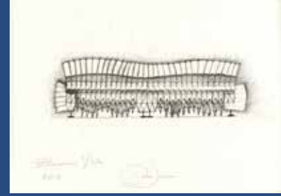
テオ・ヤンセンのスケッチ / 2013年