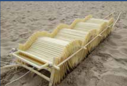
《アニマリス・カリブス》2018年