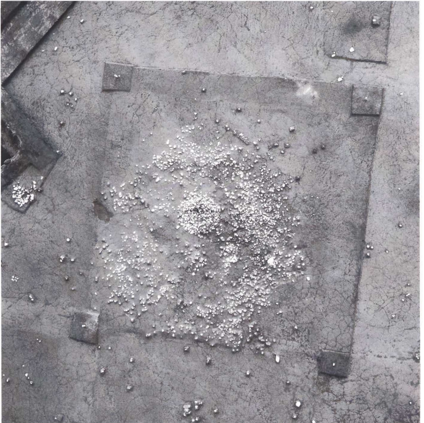
しゅうせき いこう さんれき 集石遺構と散礫（川南町 中ノ迫第2遺跡）

発行日 平成18年3月20日 発行 宮崎県埋蔵文化財センター 本館 〒880-0212 宮崎市佐土原町下那珂4019番地 分館 〒880-0053 宮崎市神宮2丁目4番地4号