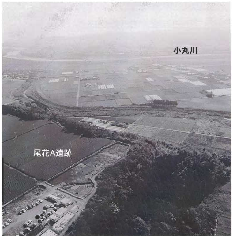
尾花A遺跡近景（北から）

ています。今後の調査によってそれぞれの時期における集落の広がりが明らかになっていくことが期待できます。この他にも古墳時代後期では竪穴住居跡や轡（馬具の一種）が出土した土坑、また古代・中世では掘立柱建物跡や石組遺構、道路として利用された可能性も考えられる溝状遺構などが見つかり