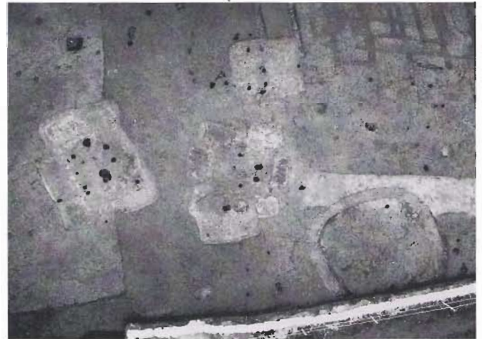
竪穴住居跡（花弁状）と周溝状遺構の完掘状況

竪穴住居跡については、南九州地方に多く見られる独特の花弁状住居も検出され、埋土中から土器のほか磨製石鏃が数点とモモの種子と思われる遺物が出土しました。