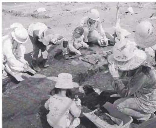
土の中の遺物を探しています