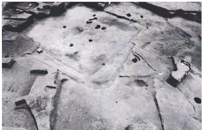
複雑に重なり合う竪穴住居跡群