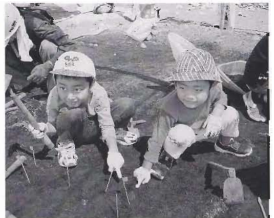
土器を見つけたよ！