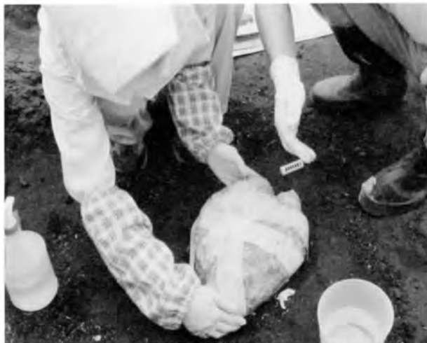
炭化材をウレタン補修テープで固定