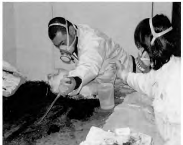
スポイトを使用した薬品の塗布