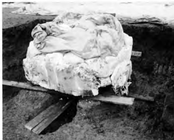
トンネルを通し反転用の井桁を当て込む