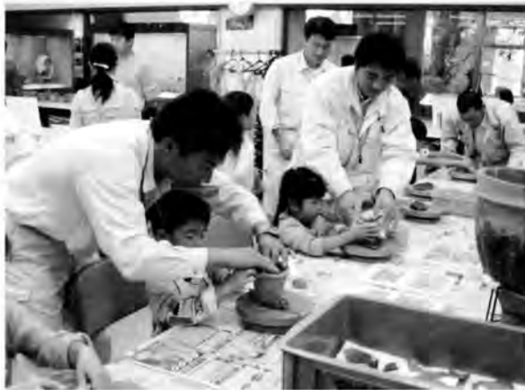
施設公開のようす（土器づくり）