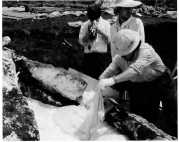
裏面の土の掘削とウレタンの流し込み