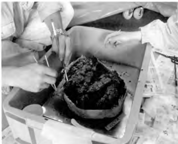
キムタオルの除去