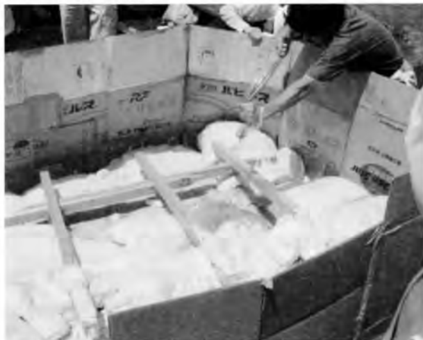
発泡ウレタン樹脂の流し込み