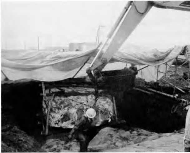
バックホーを使って反転