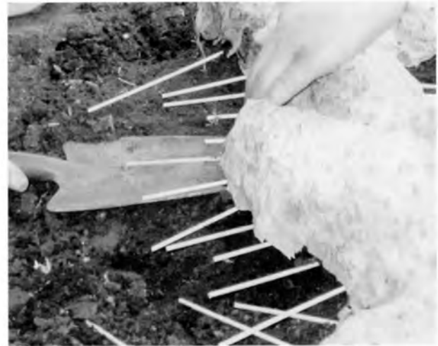
移植ゴテと竹串を使って切り離す