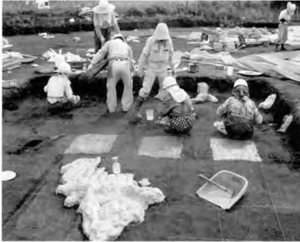
50cm 毎に区切りNAD-10Vを塗布