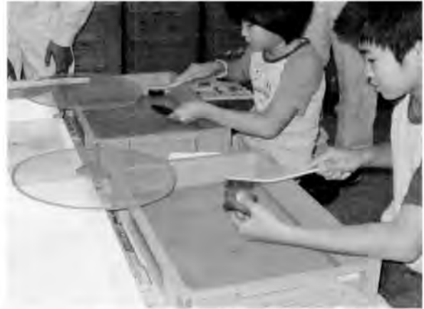
施設公開のようす（土器の洗浄）