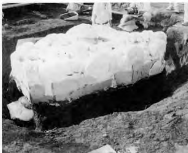
ウレタンの表面保護と四隅と中央部以外の掘削