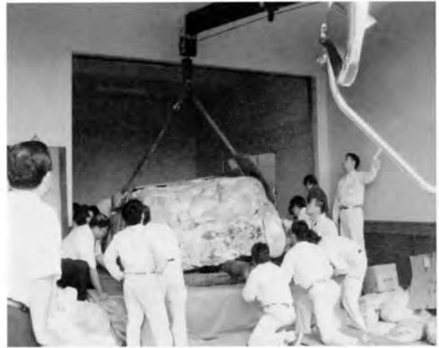
センター本館搬入