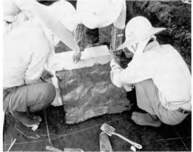
乾燥させ5mm程度の厚みで剥がす