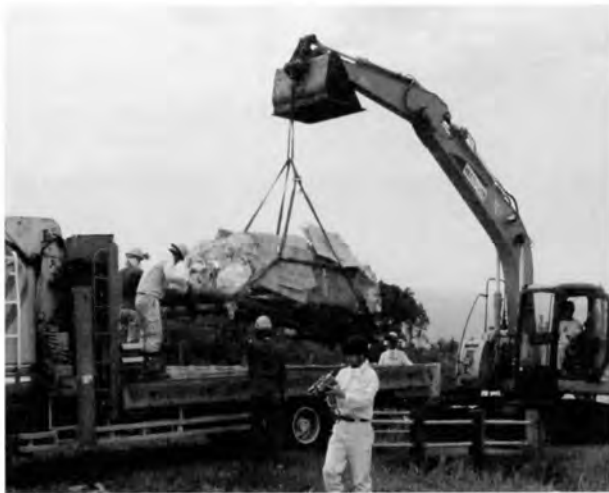
吊り上げと積み込み