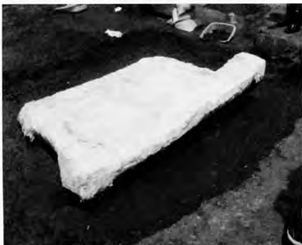
取り上げ範囲周辺の掘り下げとキムタオルによる保護