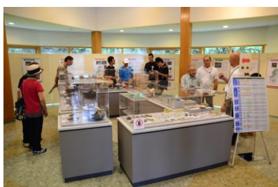
五ヶ瀬会場の展示