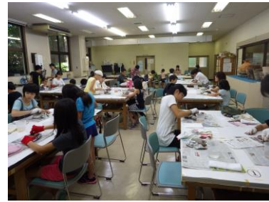
体験講座（石の矢じり制作体験）