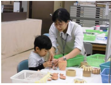
施設公開（接合体験）