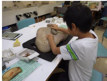
施設公開（ドングリつぶし体験）