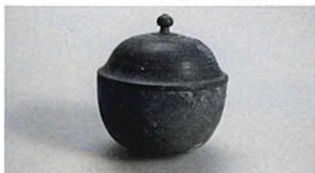
池内横穴墓11号出土の銅鉢