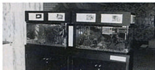
エントランスホールの水そう

宮崎県内に普通に見られたなじみのある種類ですが、農業や河川改修の影響で生息地がかなり狭められています。また、カダヤシ(タツミノ・帰化動物)が、メダカの領域まで侵入し、追いやっています。