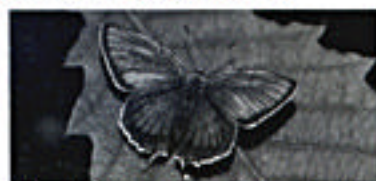
ブナを食草とするフジミドリシジミ