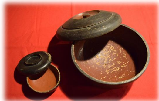
ヒラ (諸塚村) メシビツ (日之影町)