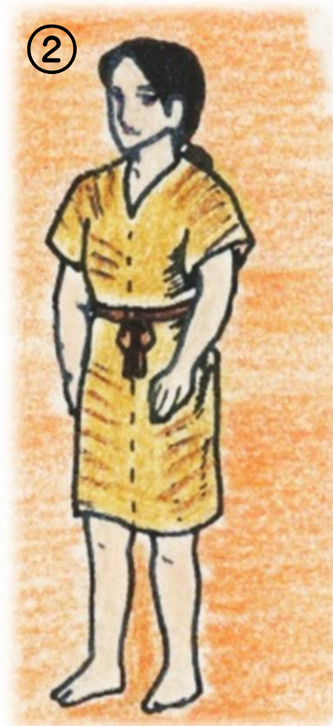
貫頭衣 (かんとうい)