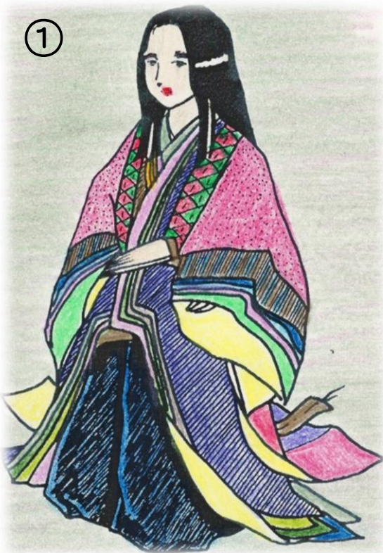
十二単 (じゅうにひとえ)

や よい じ だい ひ と き ふ く 弥生時代の人 ひと が着 き ていた服 ふく は、どれでしょう？