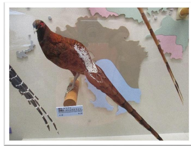
③ コシジロヤマドリ